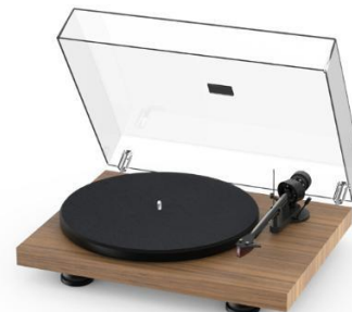
Satin Real-Wood Walnut Veneer