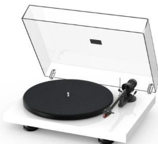
High Gloss White