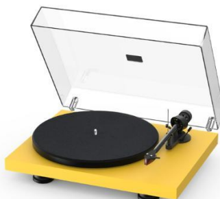
Satin Golden Yellow