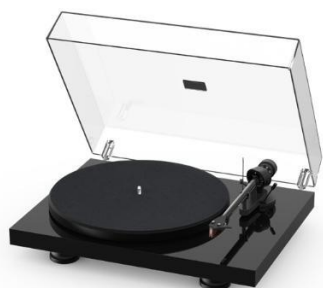
High Gloss Black