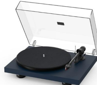
Satin Steel Blue