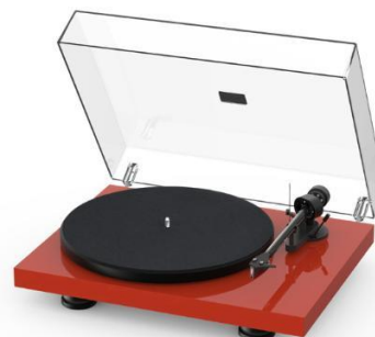
High Gloss Red