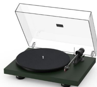
Satin Fir Green